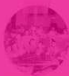
Speelgoed in het Kinderziekenhuis